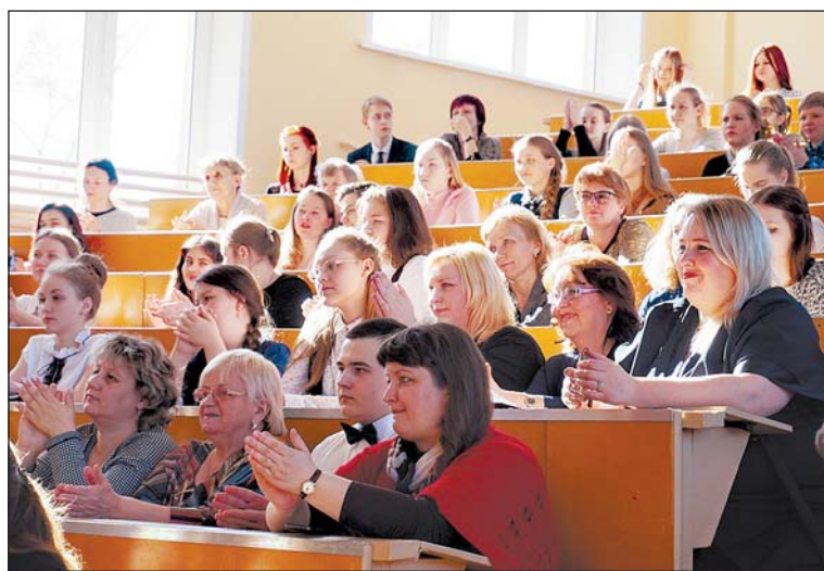
Во время работы секции

дения «В тени столетий». Новшеством олимпиады стала работа трех краеведческих секций, где участники представили членам жюри стендовые доклады.