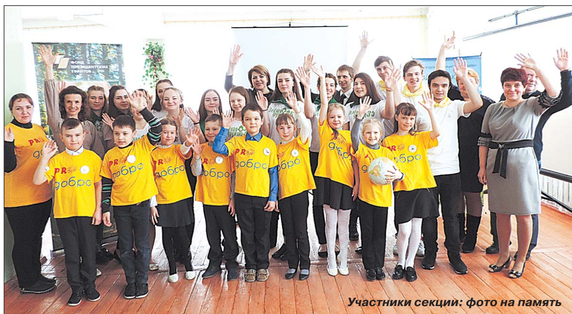
Участники секции: фото на память

акциях «Родному поселку - заботу и внимание юных экологов», «Посади дерево - сохрани природу», «Чистым рекам - чистые берега» и многих других. Они занимаются реализацией конкретных экологических проектов.